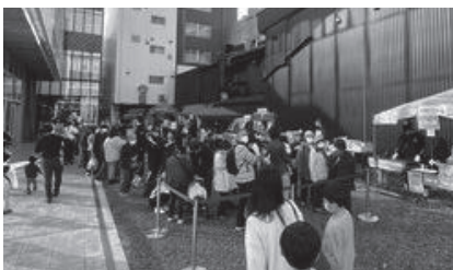
地域連携ブランド研究委員会

11月26日、27日の2日間、マチニワとマチニワに隣接するジャリニワにて地域連携ブランド研究委員会が主催する「三八肉サミット」が開催されました。このイベントは地域の畜産品や食の魅力発信と街の活性化を目的としたもので、「わかもの巣」「イチカワファーム」「西村牧場」「極肉麺たいし」「ココロトカフェ」「クワトロロジージュ」「キッコウセイ」（各敬称略）の皆様に出店いただきました。さらに八戸青年会議所広域ブランド連携委員会が企画した「スクラム8バーガー」も販売され、このバーガーには八戸市『米粉』・三戸町『エゴマ』・五戸町『ごぼう』・田子町『にんにく』・南部町『りんご』・階上町『海藻』・新郷村『ヨーグルト』・おいらせ町『ハーブ』といった近隣8市町村の特産を活かした食材が使用され追加販売も完売するほどの大好